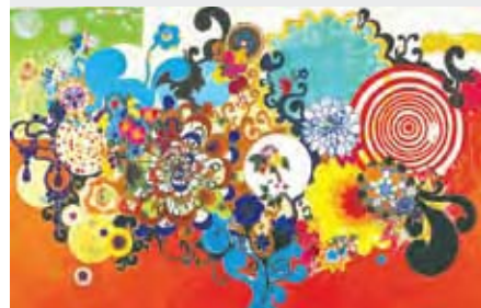
Beatriz Milhazes. O Mágico, 2001